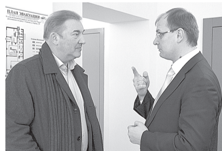
В совещании с предпринимателями принял участие депутат Государственной думы Владислав Третьяк.

А вот избавить бизнес от дополнительной административной нагрузки оказалось не так легко, хотя решение, казалось бы, очевидно. Предложение отменить обязанность по предоставлению в орган государственной статистики экземпляра годовой бухгалтерской отчетности поступило из Новоспасского района. Предприниматели мотивировали это тем, что указанная отчетность итак сдается в налоговую службу, и вместо того, чтобы лишиться раз нагружать бизнес, ведомства могли бы наладить взаимодействие между собой. Сложность же заключается в том, что изменить ситуацию может только принятие постановления на федеральном уровне.